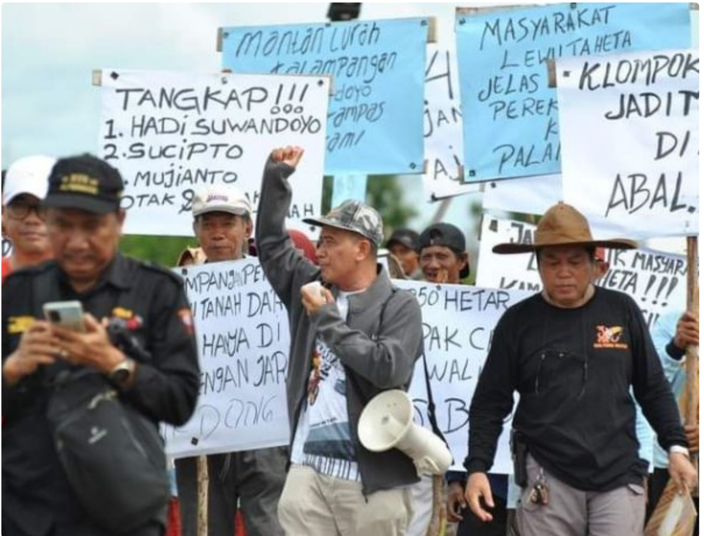
Gambar: Aksi Unjuk Rasa Masyarakat Kelompok Tani

PALANGKA RAYA - Sengketa kepemilikan tanah yang terjadi di Kota Palangka Raya selama ini, cukup meresahkan. Hal ini tentunya bisa mempengaruhi geliat