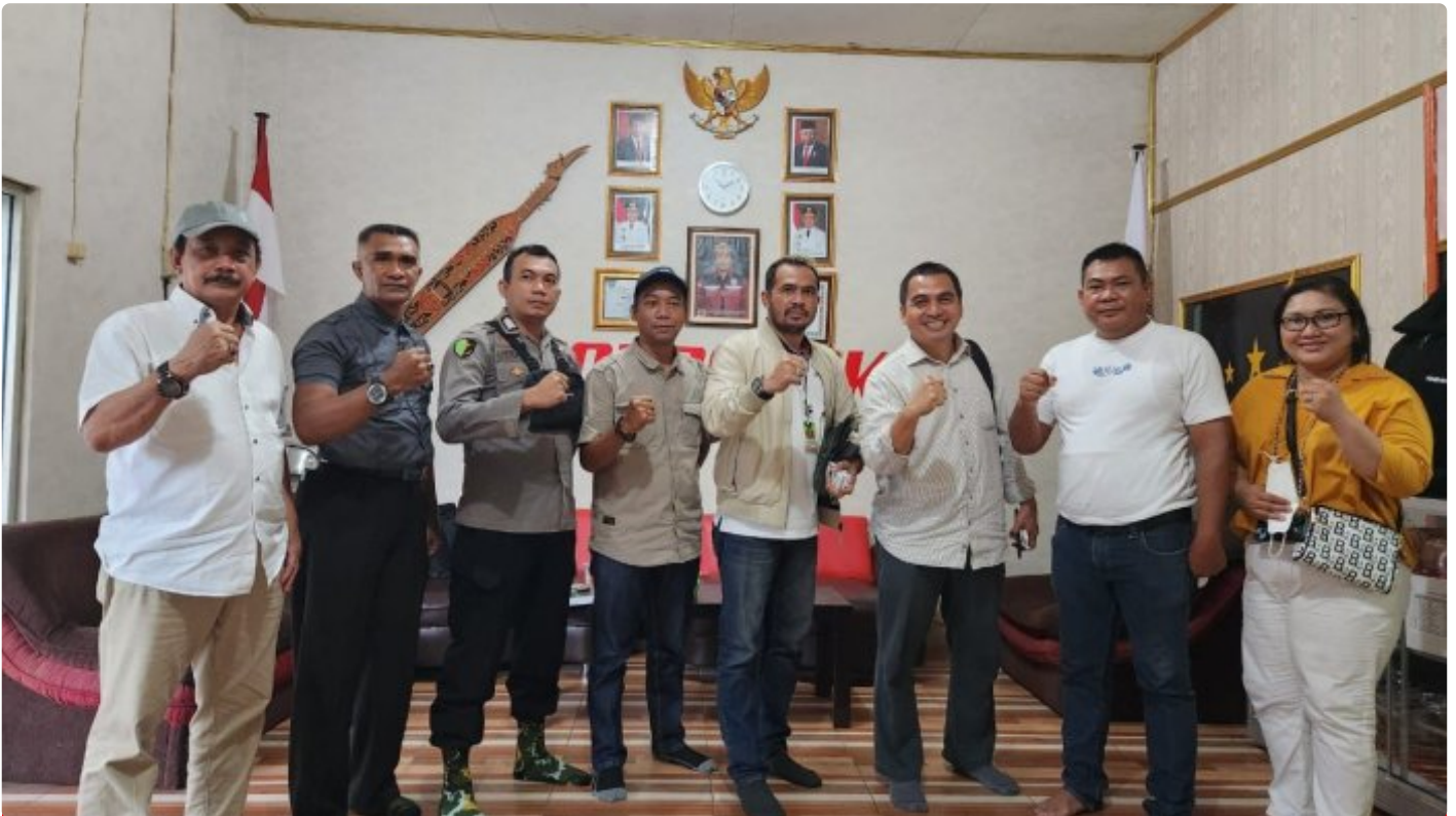
Tim PT Agasa Kalimantan Tengah

PALANGKA RAYA - PT Agasa Kalimantan Tengah (PT Agasa Kalteng) merupakan Badan Usaha Jasa Pengamanan (BUJP) Perusahaan lokal Kalimantan Tengah yang bergerak di bidang industri security, meliputi “Jasa Pelatihan Dasar SATPAM (Gada Pratama/Madya), dan Jasa Tenaga Pengamanan (Outsourcing)”.