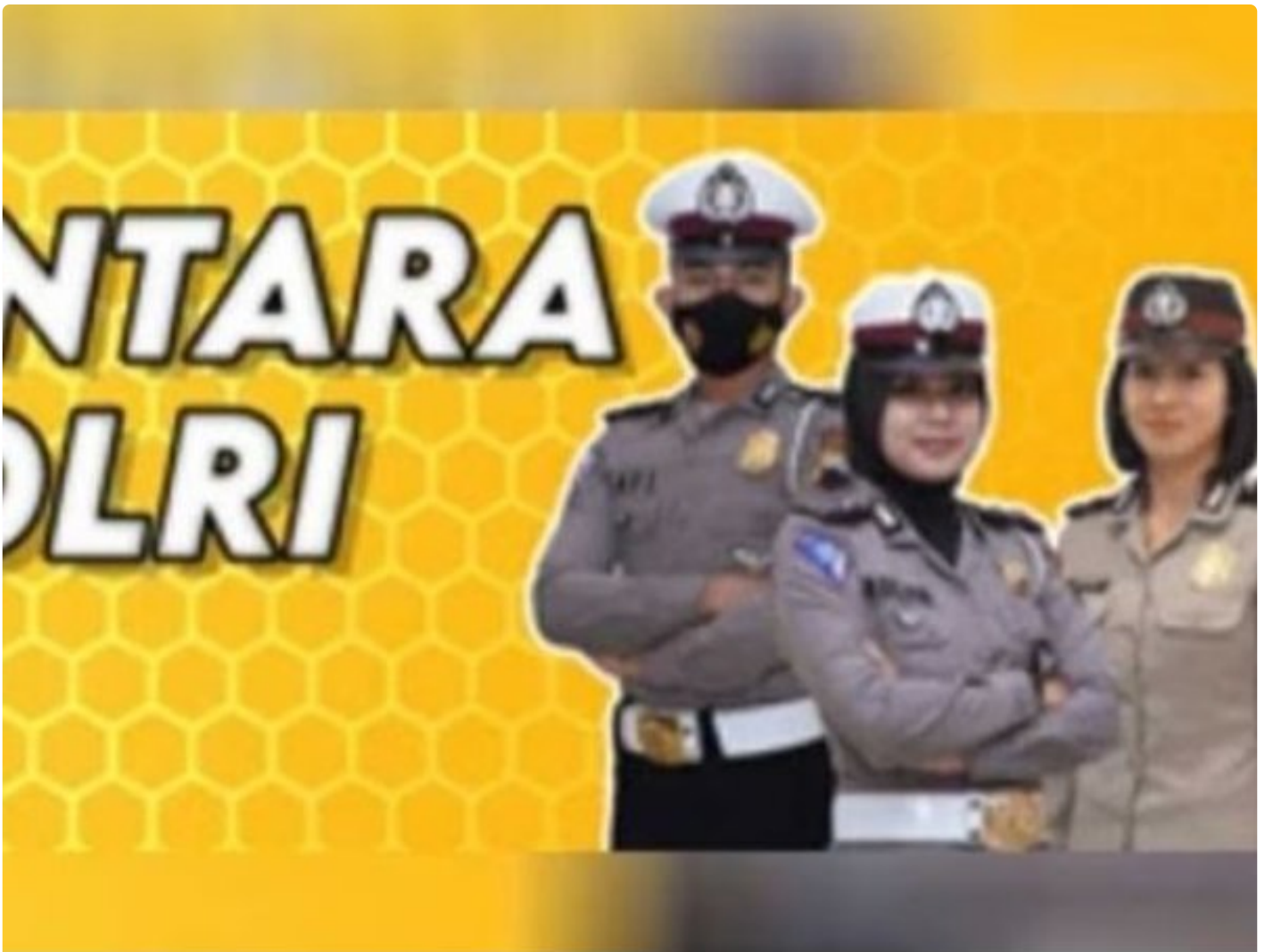
Penerimaan Polri Bakomsus

PALANGKA RAYA - Kesempatan terbuka bagi lulusan bidang pertanian, perikanan, peternakan, gizi, dan kesehatan masyarakat untuk bergabung menjadi