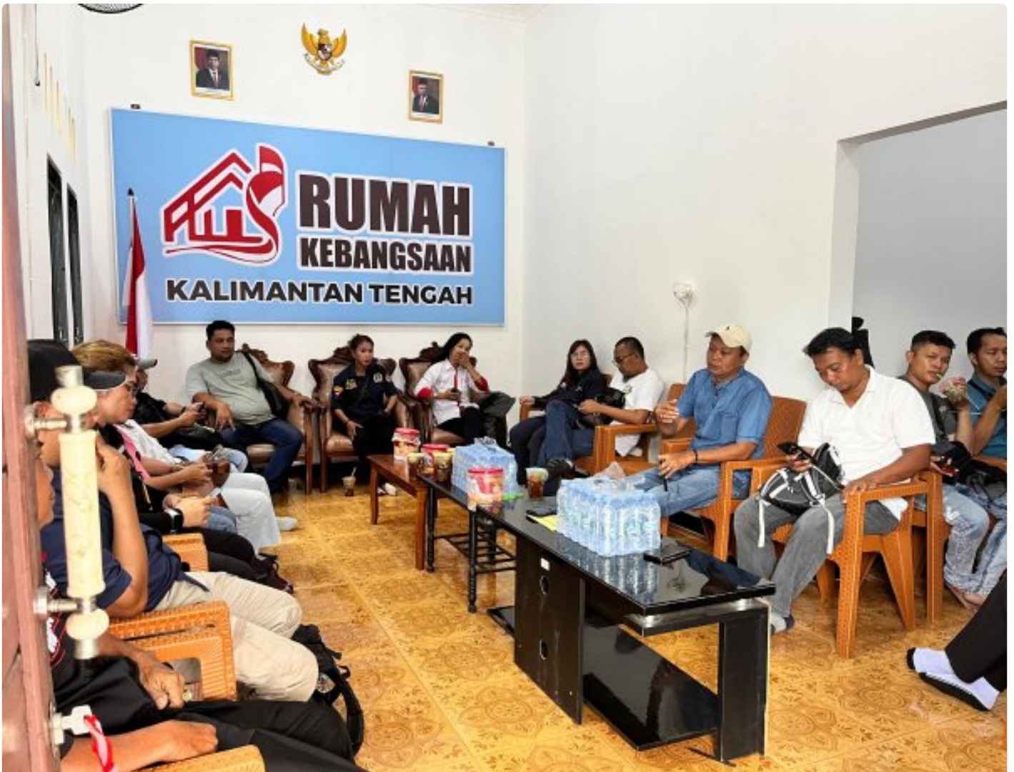
Gambar: Acara Ramah Tamah di Rumah Kebangsaan Kalteng

PALANGKA RAYA - Pelaksanaan pemilihan kepala daerah (Pilkada) yang akan dilaksanakan secara serentak di seluruh wilayah Republik Indonesia, tahun 2024